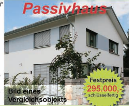
Bild eines Vergleichsobjekts

Passivhaus "Satteldach 100" mit 164 m 2 Wohnfläche, 5 Zi., allseitig gedämmter Vollkeller, Hobbyraum/ Arbeitsraum zum Ausbau vorbereitet, 3-Scheiben- Energiesparverglasung, hochwertiger Dämmung, wärmebrückenfrei, Komfort- Lüftung in allen Räumen, hocheffiziente Haustechnik/ Wärmepumpe.