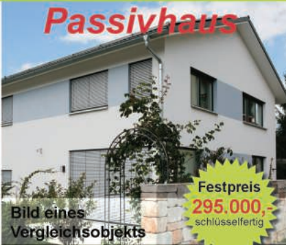
Bild eines Vergleichsobjekts

Passivhaus "Satteldach 100" mit 164 m 2 Wohnfläche, 5 Zi., allseitig gedämmter Vollkeller, Hobbyraum/ Arbeitsraum zum Ausbau vorbereitet, 3-Scheiben- Energiesparverglasung, hochwertiger Dämmung, wärmebrückenfrei, Komfort- Lüftung in allen Räumen, hocheffiziente Haustechnik/ Wärmepumpe.