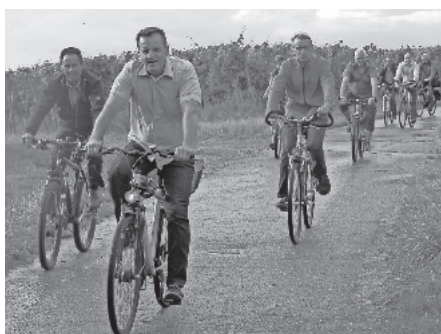
Schuster unterwegs mit Veranstaltungsteilnehmern

Eine große Gruppe interessierter Bürgerinnen und Bürger begrüßte den Abgeordneten an der Sonnenbergschule, wo Bürgermeister Bernhard Fehrenbach das Projekt Kindergartenneubau und Ganztageschule hin zum „Bildungshaus“ erläuterte. Der 4,4 Millionen Neubau soll zukünftig nicht nur ein großes Angebot verbesserter Öffnungszeiten im Kindergarten gewährleisten, sondern mit zusätzlichen Räumlichkeiten für die Sonnenbergschule den Ganztageschulbetrieb ermöglichen. Hierfür haben sich 50 Schüler bereits im ersten Jahr des Angebots für die Ganztageschule entschieden. Als besondere Betreuung kann das Mittagessen zukünftig auch in der neuen gemeinsamen Mensa eingenommen werden. Schuster unterstützte die Sichtweise der Kommunalpolitiker „man mag dazu stehen wie man will, aber ein Ganztagesangebot ist die Grunderwartung der Eltern“.