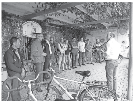
Begrüßung vor der Sonnenbergschule

Auf Einladung des CDU-Ortsvorsitzenden, Marco Reiner besuchte der Bundestagsabgeordnete Armin Schuster den Wein- und Erholungsort um sich über aktuelle Themen zu informieren.