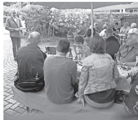
Im Weingut A. Seywald

verkabelung verfüge man ja durchaus über vorzeigbare Infrastruktur. Da man sich im Gemeinderat bewusst ist, so Fehrenbach, dass es auch einen Bedarf an Mietwohnungen gibt, soll ergänzend nun auch „Holzweg IV“ mit Geschoßwohnungsbau überplant werden. Anerkennend verglich Schuster Ballrechten-Dottingen mit anderen Gemeinden und wünschte für die Umsetzung der Planungen viel Erfolg.