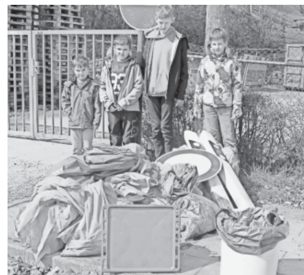
Kinder zeigen stolz ihre „Beute“

Es bleibt weiterhin die Hoffnung, dass es zukünftig weniger Müll auf der Gemarkung gibt und wenn doch, dass sich Initiatoren und Freiwillige finden, die sich um den unachtsam weggeworfenen Unrat kümmern.