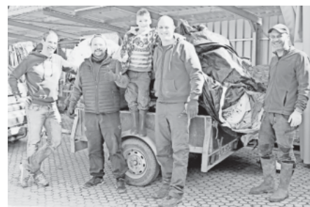
Nichts blieb diesen Umweltaktivisten verborgen.