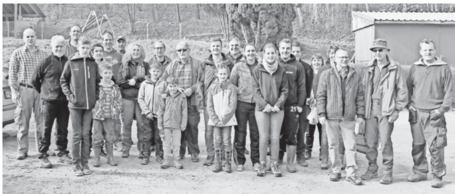
Eine stattliche Anzahl rückt dem Müll zu Leibe