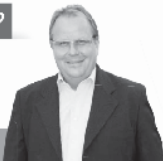
Regionmakler GmbH - Hartheim

Das mit einem erfahrenen, zuverlässigen Partner? Profitieren Sie von unserer Mehr-Wert-Strategie! Rufen Sie uns an, es lohnt sich für Sie