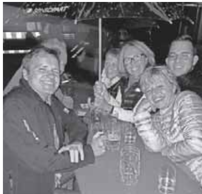
Selbst vom Regen ließen sich die Musikfreunde nicht abhalten.