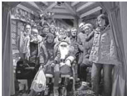
Ein Abordnung des MVBD's mit einigen Jungmusikern sorgte für weihnachtliche Stimmung in Bad Krozingen.